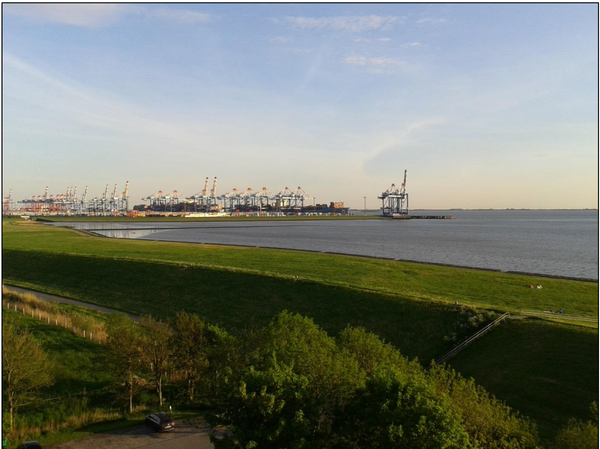
Foto: Blick auf den Containerhafen

Der Stadtteil Weddewarden und das angrenzende Imsum grenzen direkt an die Weser. Dadurch steht den Einwohnerinnen und Einwohnern von Weddewarden und Imsum ein tolles Naherholungsgebiet zur Verfügung. Vom Deich aus hat man eine gute Aussicht z. B. auf das Hafengebiet. Genießen Sie zusammen mit Ihren Kindern den Anblick der vorbeifahrenden Schiffe und die frische Luft! Die Grünflächen vor dem Deich sind auch für ein Familienpicknick geeignet.