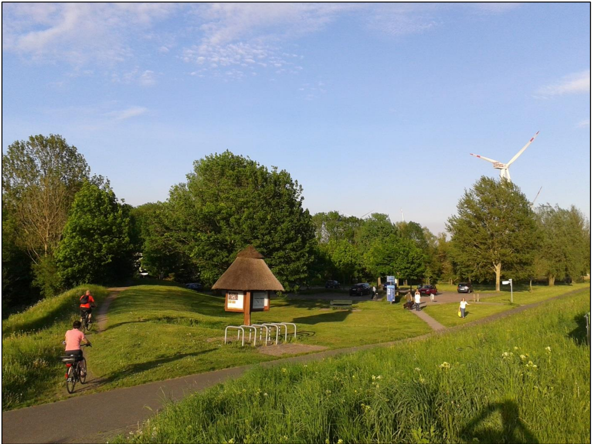
Foto: Mehrere Fahrrad- und Wanderwege führen durch Weddewarden. Auf dem Foto sind überdachte Hinweisschilder und Fahrradständer zu sehen.