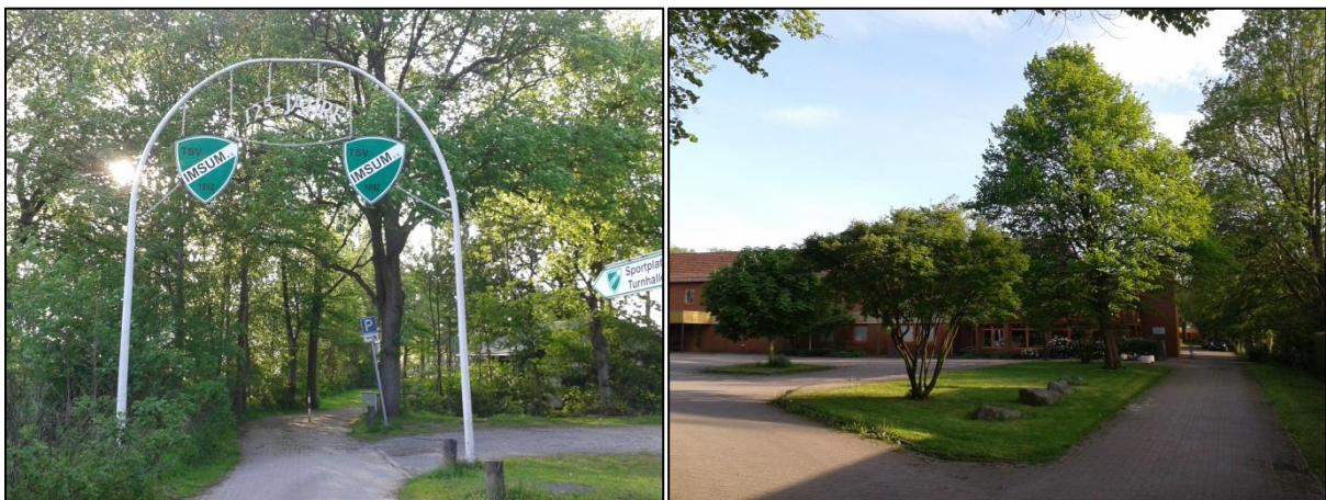
Foto links: Den TSV Imsum gibt es 2017 bereits seit 125 Jahren. Dies wurde gefeiert.

www.bremerhaven.de/de/leben-arbeiten/familien-kinder/familienportal/sport-tsv-imsum.74238.html