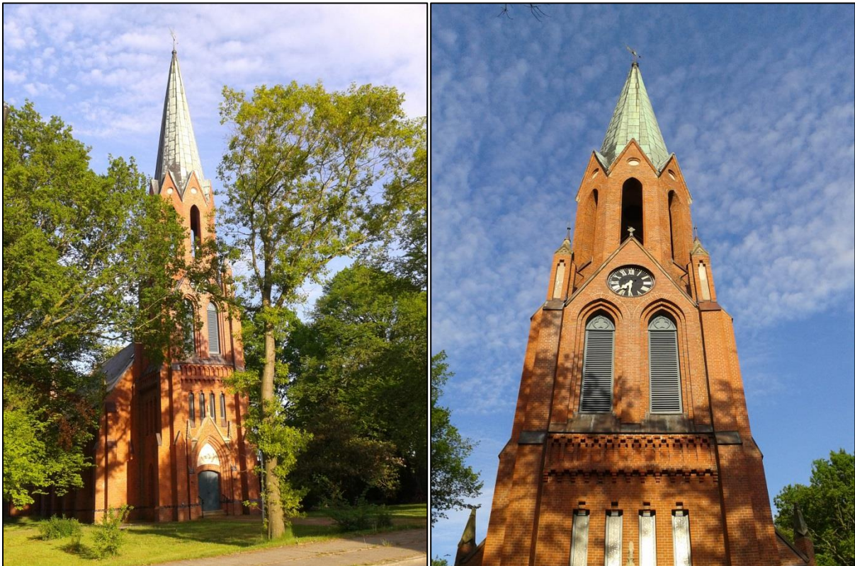
Fotos: Die Zionkirche (links: Gesamtansicht, rechts: Kirchturm). Das Gemeindehaus befindet sich neben der Kirche.

Am dritten Samstag im Monat (10:00 bis 11:30 Uhr) findet im Gemeindehaus der Zionkirche „Kirche mit Kindern“ für Kinder von 4 bis 12 Jahren statt. Die Kinder können z. B. spielen, singen, malen, basteln, biblische Geschichten hören, erzählen und nachspielen. Auch essen und trinken gehören dazu.