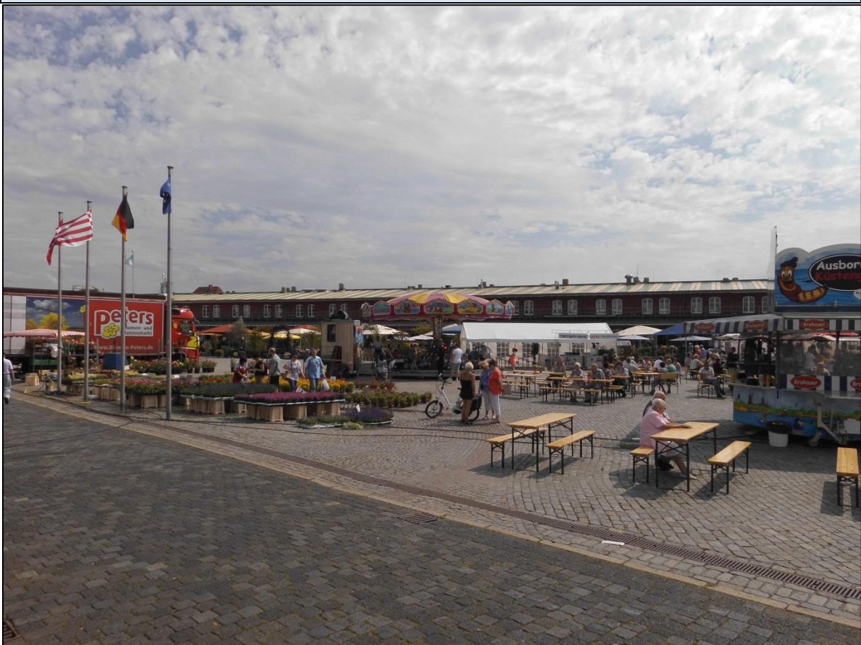
Foto: Im Schaufenster Fischereihafen finden zahlreiche Veranstaltungen statt, bei denen es auch Angebote für Familien mit jüngeren Kinder gibt. Im Bild zu sehen: das Kinderkarussell bei einem Bauernmarkt.

Es gibt noch einige weitere Angebote im Ortsteil Fischereihafen, jedoch richten sich diese eher an ältere Kinder. So wird die im Schaufenster Fischereihafen beheimatete Ausstellung „ Expedition Nordmeere “ für Kinder ab etwa 8 Jahren empfohlen. Auf dem Museumsschiff „ Gera “ werden zwar kindgerechte Informationen bereitgehalten, aber auch diese Attraktion richtet sich eher an etwas ältere Kinder, ebenso wie die Vorführungen im „ Theater im Fischereihafen “ (TiF). Darüber hinaus gibt es noch die Möglichkeit, an einer Hafenrundfahrt durch den Fischereihafen teilzunehmen, die schon jüngere Kinder mitmachen können, auch wenn sie nicht zur Hauptzielgruppe gehören. Dies gilt ebenfalls für eine Fahrt mit der Museumseisenbahn nach Bad Bederkesa, die hier eine Zustiegsmöglichkeit bietet. Ab etwa 7 Jahren können Kinder an einer GPS-Tour teilnehmen. Die GPS-Geräte können in der Tourist Information ausgeliehen werden. Es gibt zahlreiche weitere Angebote aus den Bereichen Sport und Tanzen sowie Kunst und Kultur . Über das Jahr finden auch viele Feste und sonstige Veranstaltungen im Schaufenster Fischereihafen statt, bei denen es auch Angebote für Familien mit jüngeren Kindern gibt. Unter www.schaufenster-fischereihafen.de finden Sie den aktuellen Veranstaltungskalender.