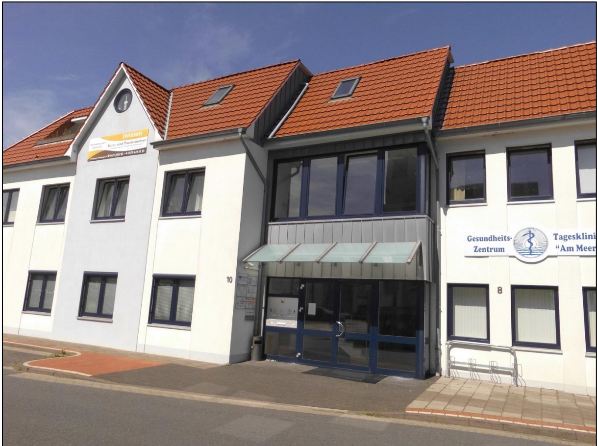
Foto: In der Herwigstraße 8 befindet sich sowohl eine gynäkologische als auch eine kinderärztliche Praxis.