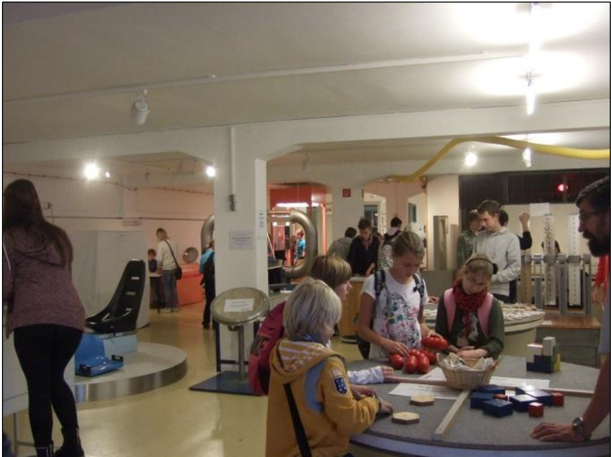
Foto: Mitmachaktion in der Phänomena Flohmärkte

www.bremerhaven.de/de/leben-arbeiten/familien-kinder/familienportal/phaenomena-bremerhaven-e-v.73469.html