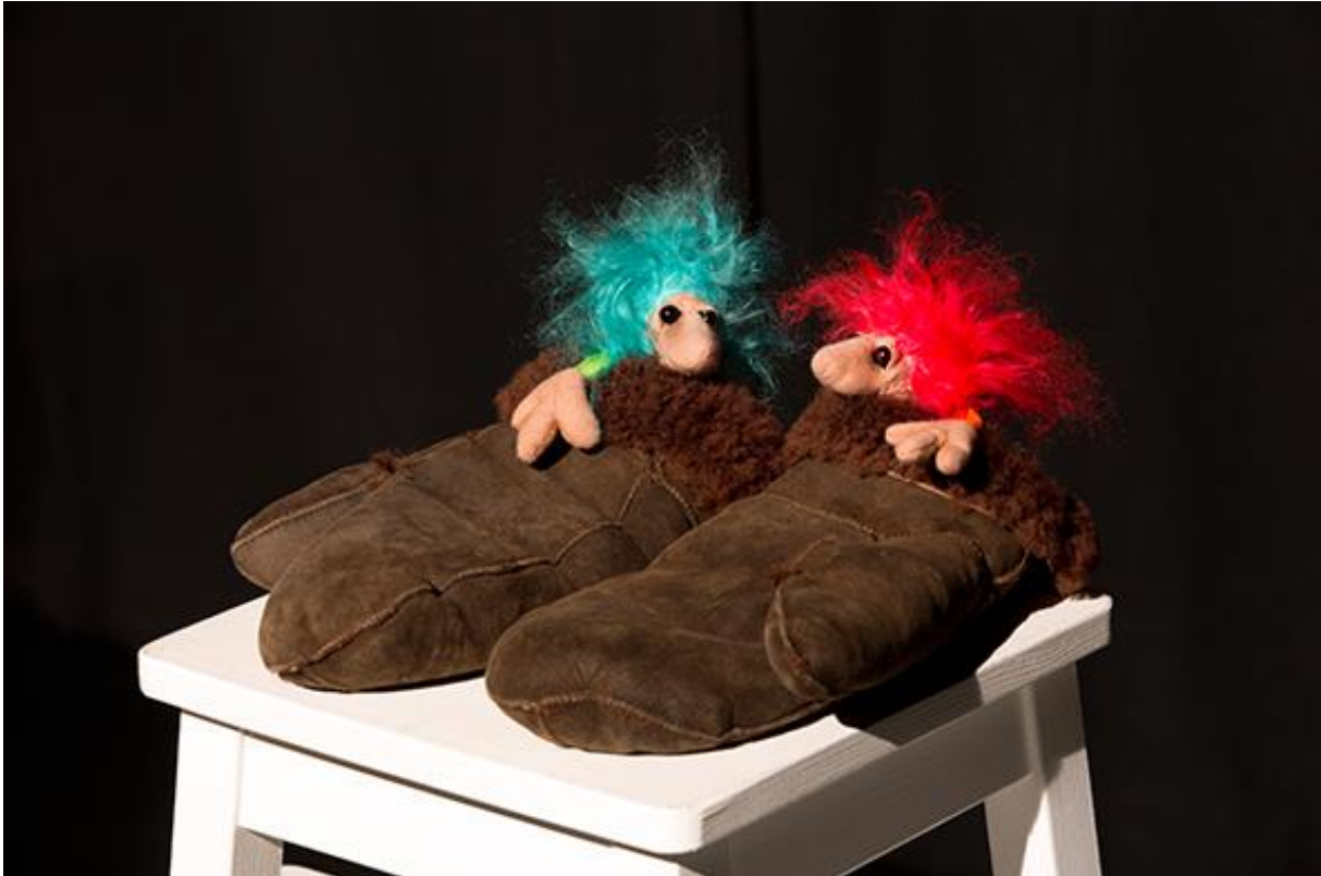
Foto: Figuren aus dem Stück „Na los, kleiner Meierling“ (Das Foto wurde freundlicherweise vom Figurentheater zur Verfügung gestellt.)